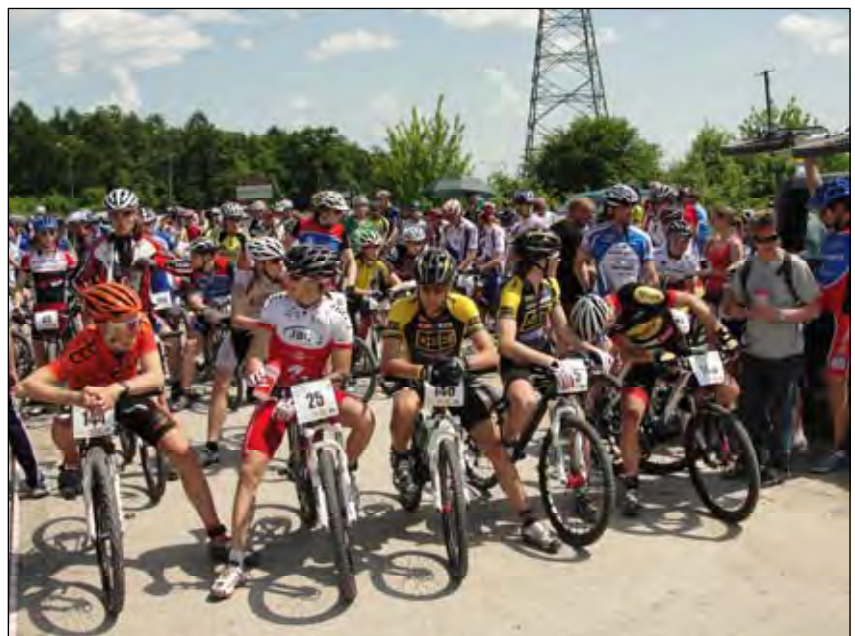
Męska reprezentacja Wszechnicy na starcie wyścigu

Redaktor prowadząca: Monika Krzemińska; korekta: Paulina Zaborek, redakcja techniczna: Sławomir Jakóbczak.