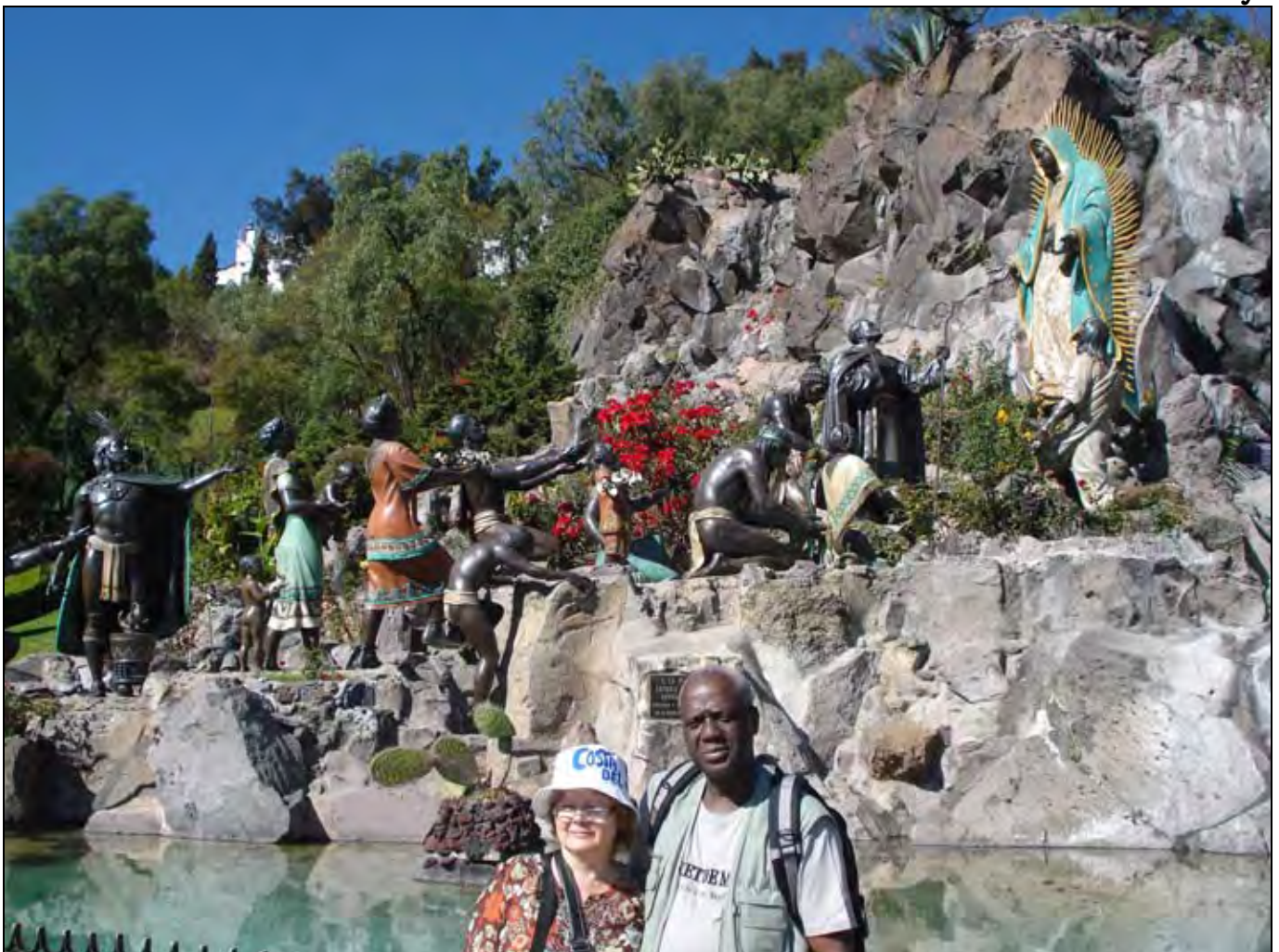
Kompleks Bazyliki Matki Boskiej z Guadalupe