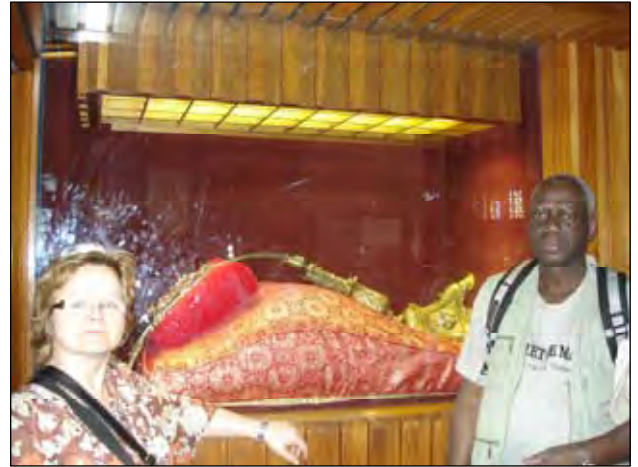
Złoty krzyż w nowej bazylice

Na koniec podziwialiśmy sanktuarium Najświętszej Marii Panny w Guadalupe. Do najistotniejszych budowli tego miejsca zaliczają się stara i nowa bazylika. W nowym kościele znajduje się cudowny obraz