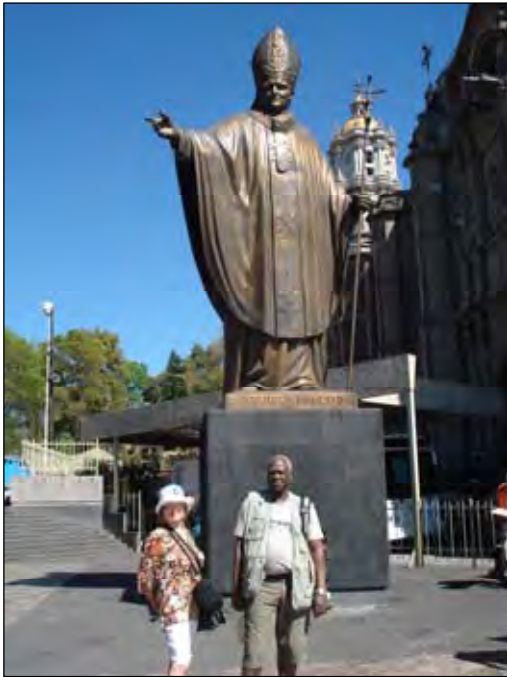
Pomnik Papieża Jana Pawła II

Inne wartościowe obiekty tego sanktuarium stanowią: pomnik papieża Jana Pawła II oraz figury obrazujące pielgrzymów u stóp Matki Boskiej z Guadalupe.