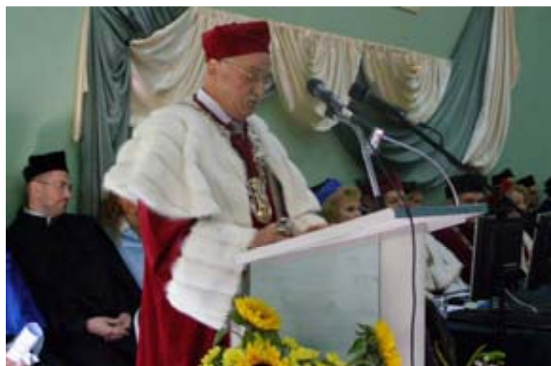
Inauguracja roku akademickiego 2008/2009

Podsumowując – Wszechnica Świętokrzyska, obok wielu złożonych i różnorodnych zadań związanych z kształceniem, dba także o tworzenie własnego środowiska naukowego. [...] Świadczą również o tym przeprowadzone w bieżącym roku przez członków Państwowej Komisji Akredytacyjnej wizytacje. W wyniku kontroli, czy też lustracji, otrzymaliśmy kolejne pozytywne oceny kształcenia na Wydziale Wychowania Fizycznego i Turystyki, na kierunkach: wychowanie fizyczne oraz turystyka i rekreacja.