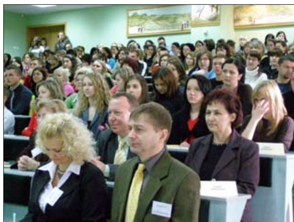
Licznie zgromadzeni słuchacze konferencji