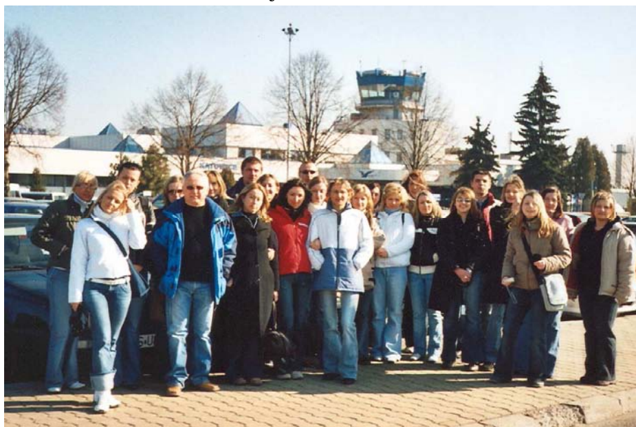
Grupa przyszłych pilotów na lotnisku w Pyrzowicach