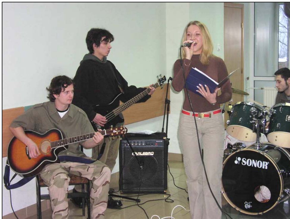
Poprzedni skład zespołu podczas koncertu kolęd 22 stycznia 2005 r.

Dokonyjemy nowych opracowań tych utworów, które są popularne wśród młodzieży, ale jednocześnie będą się podobać osobom trochę starszym. Mam ambicje, aby powstawały utwory własne. Jest to możliwe, ponieważ młodzi muzycy to pasjonaci, którzy chcą realizować siebie właśnie poprzez twórczość, w każdym jej obszarze. Ufam zatem, że będą powstawać dobre teksty i dobra muzyka. Tym bardziej, że sprzęt, jaki ma do dyspozycji zespół, jest znakomity. Zapraszam wszystkich chętnych studentów do pracy.