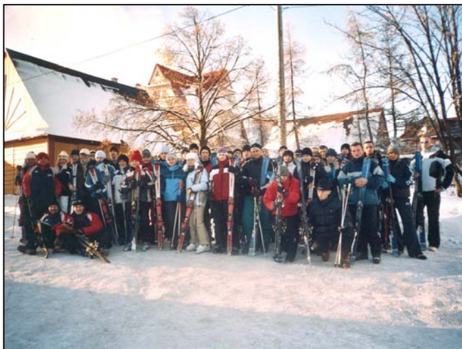
Uczestnicy I turnusu, studenci II roku kierunku WF (studia dzienne)

Zakończyły się obozy zimowe w Bukowinie Tatrzańskiej. W obu turnusach uczestniczyło ponad stu studentów.