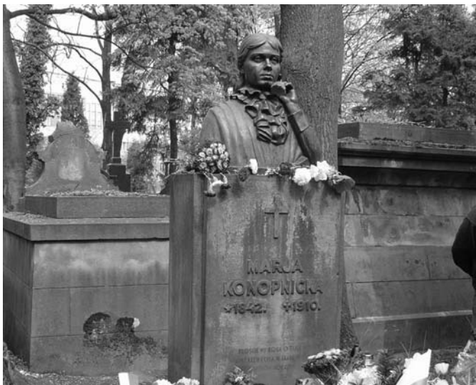
Grób Marii Konopnickiej na Cmentarzu Łyczakowskim.

Uczestnicy wycieczki mieli okazję podziwiać odnowiony Cmentarz Orłat Lwowskich, gdzie znajdują się groby Polaków, którzy polegli w czasie wojny polsko-ukraińskiej w latach 1918-1919. W obronie Lwowa stanęli wówczas lwowscy młodzieńcy, którzy z wielką odwagą i patriotyzmem walczyli o polskość miasta. Cmentarz Orłat Lwowskich stanowi naszą Narodową Nekropolię. Cmentarz Orłat Lwowskich we Lwowie stanowi część Cmentarza Łyczakowskiego, na którym pochowanych jest wielu wybitnych Polaków: przedstawicieli nauki, sztuki, polityki, uczestników powstań narodowych, bojowników o wolność i niepodległość Polski.