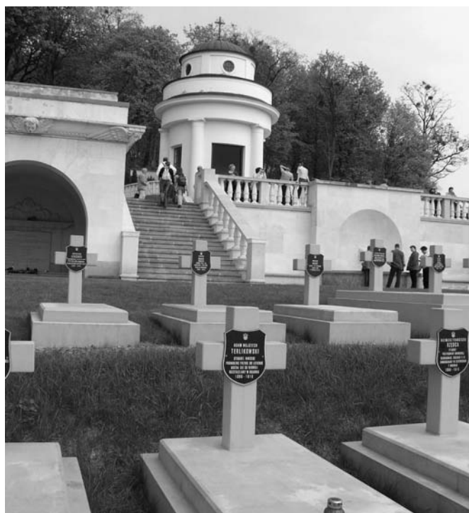
Odnowiony Cmentarz Orłat Lwowskich.