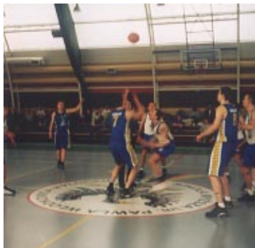
Graliśmy z pasją

✓ W naszej Uczelni powstała właśnie bilardowa sekcja AZS, związana ze Studencką Amatorską Ligą Bilardową. Członkowie sekcji reprezentują Wszechnicę Świętokrzyską w zmaganiach z reprezentacjami innych kieleckich szkół wyższych (AŚ, WSU, PŚ, WSZGRiT) walcząc jednocześnie o zdobycie cennych nagród. W chwili obecnej rozpoczęły się już rozgrywki ligowe, zakończą się one w końcu czerwca. Miejmy nadzieje, że nasza reprezentacja również w tej dyscyplinie sportu odniesie liczne sukcesy.